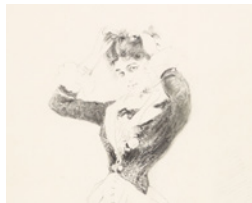
Bleistiftzeichnung Carl Spitteler's, vermutlich 1870er Jahre.

Hôtel de la Rose Rue de Morat 1 1700 Fribourg www.hoteldelarose.ch